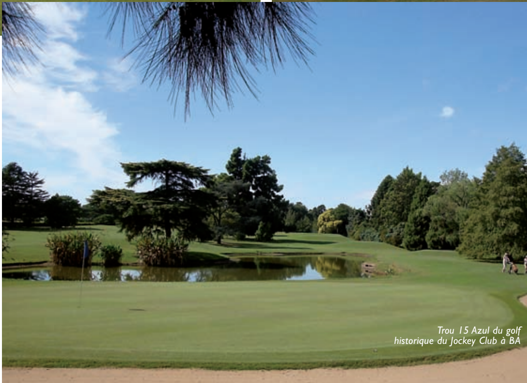
Trou 15 Azul du golf historique du Jockey Club à BA