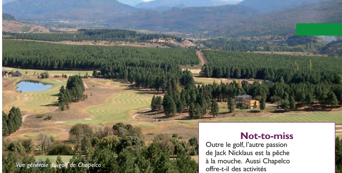
Vue générale du golf de Chapelco

El Refugio chalet-restaurant situé à 1300 m d'altitude au cœur du parc national.